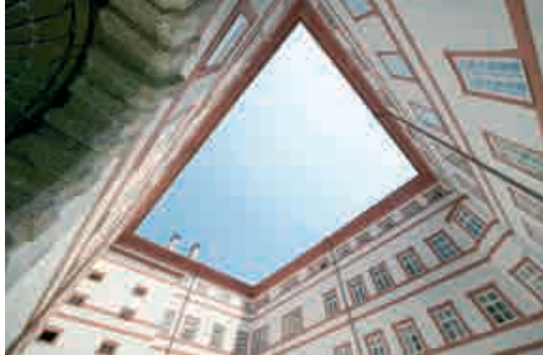
Museum Carolino Augusteum Salzburg