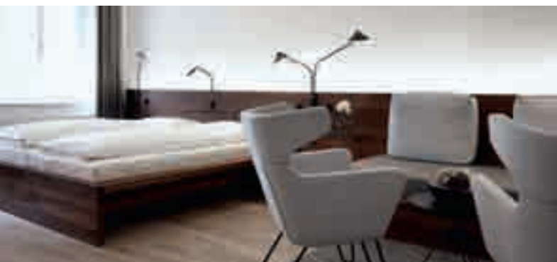
Arthotel Blaue Gans, Salzburg

Dass sich der Tischler und Handwerker vermehrt mit stilistischen und kulturellen Fragen zu beschäftigen hat, hat damit zu tun, dass wir, für jedermann erkennbar, in einer Welt des Wertewandels leben. Die Frage nach unserer handwerklichen Identität hängt fundamental also auch von der Frage unseres Gedächtnisses ab. Wo die Erinnerung schwindet, schwindet auch die Identität.